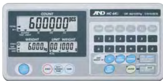
Einfaches Bedienkonzept, gut ablesbare große LCD Anzeige