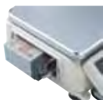
Internes, wiederaufladbares Batteriepack (optional)